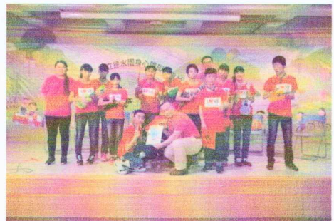
就學組-表演烏克蘭麗麗演奏