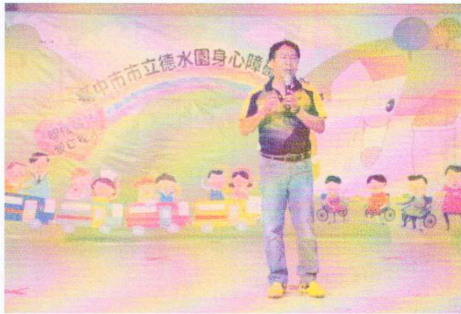
感謝各界長官蒞臨會場