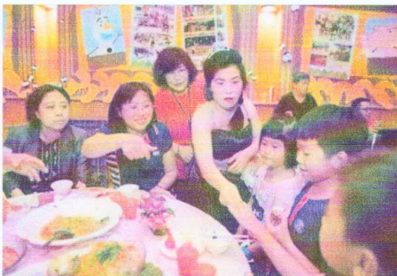
服務對象與現場來賓互動