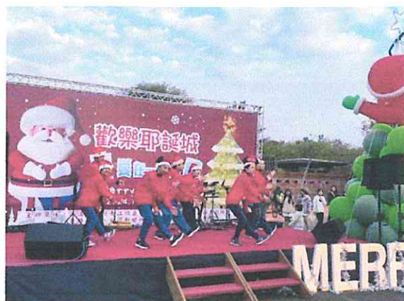
社區活動-東勢耶誕城表演