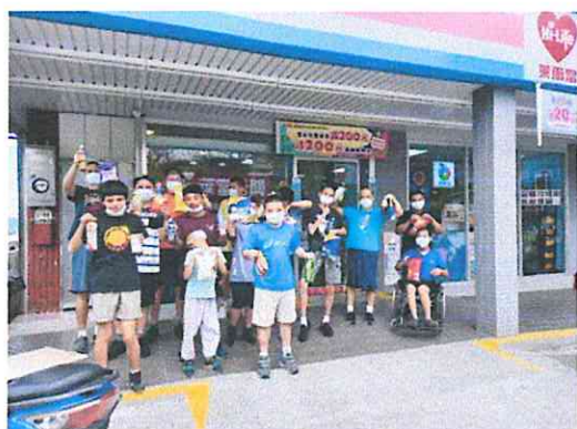
到社區中萊爾富體驗購物