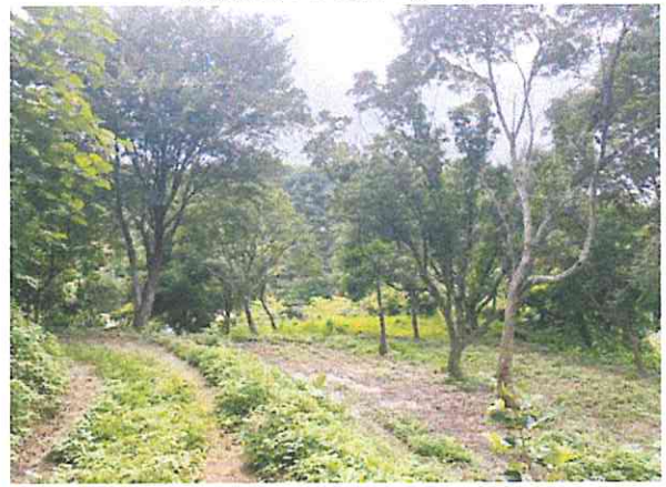
典麗園改造前-步道