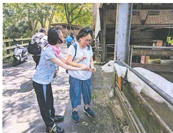
服務對象與家屬一同餵小動物