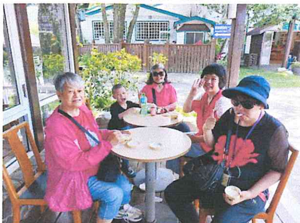
大家一起休息吃點心