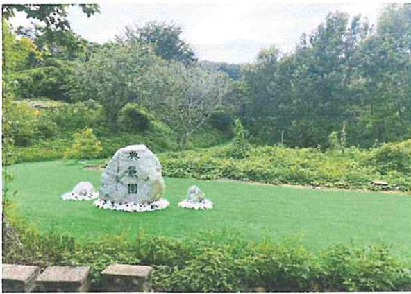
典麗園改造後-前庭