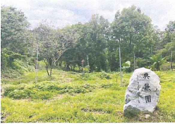
典麗園改造前-前庭