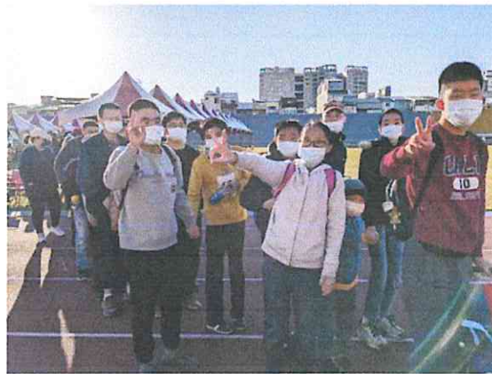
社區活動-參加雅豐盃健走活動