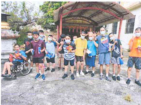
社區活動-到土地公祭拜